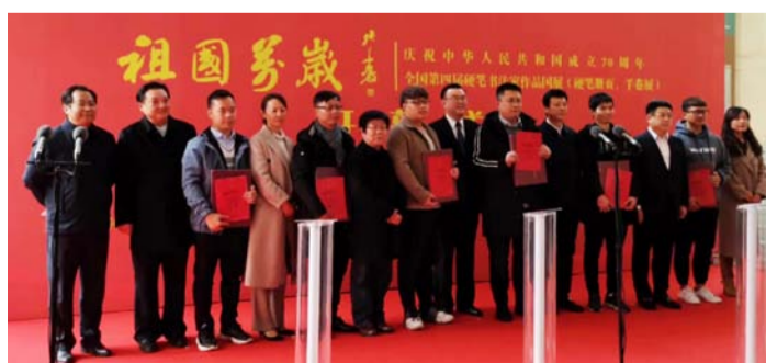
祖国万岁 全国第四届硬笔书法家大书法作品国展毛笔展区于8月14日在河北省固安县文博馆开幕；硬笔书法小品、篆刻、刻字展区于9月27日在深圳宝安开幕；硬笔册页手卷展区于12月20日在镇江市博物馆开幕。图为各展区开幕式盛况回顾